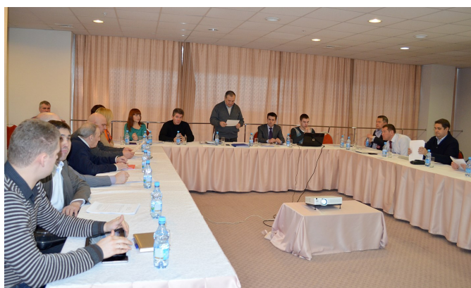
Заседание Координационного совета Оптической Ассоциации

По направлению юридической поддержки и консультирования членов Ассоциации заключено Соглашение о сотрудничестве со специализированной компанией - «Центр медицинского права», в рамках которого члены Ассоциации вправе получать соответствующие услуги со скидкой в 15 %.