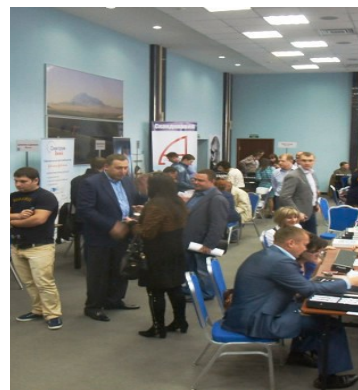
Фото с выставки

В выставке приняло участие 47 компаний-экспонентов. Количество официально зарегистрированных розничных оптик, посетивших выставку, составило — 66 предприятий (125 человек).